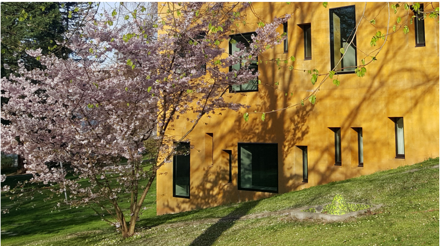
Frühlingsstimmung bei der JMS