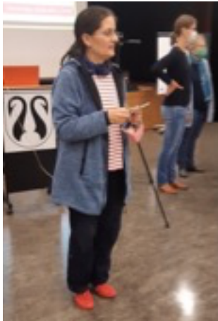
Bild 2: vier von sechs (aktuelle, bisherige) Vorstandsmitgliedern